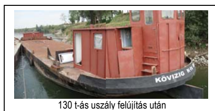
130 t-ás uszály felújítás után