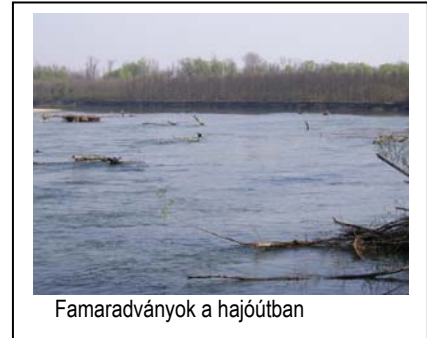
Famaradványok a hajóútban

A Dráva folyón a hajózás szabályozása a magyar és a horvát fél közti egyezmény szerint történik. A hajózás biztonsága érdekében közösen egyeztetik és állapítják meg a Dráva folyó teljes hajóútjának kitűzési és fenntartási munkáit. A Dráva folyó horvát-magyar közös határmenti szakaszán a 70+200 – 198+600 fkm között van kitűzött hajóút. A hajóút irányának, szélének és mélységének, valamint a hajózási akadályok, korlátozások és hajóműveletek helyének egyezményes jelekkel történő megjelölése valamint a hajóútban található idegen tárgyak, hajózási akadályok, eltávolítása képezi a feladatot.