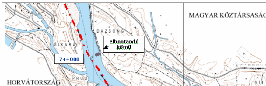
Dráva 74+000 fkm

A Dráva bal partján, a 74+000 fkm-ben levő, funkcióját már nem betöltő, az év jelentős részében a vízfelszín alatti kő anyagú keresztgát maradvány veszélyeztette a vízi közlekedés biztonságát. Hajózási kisvízszint feletti vízállás esetén a vízfelszín alatti keresztirányú szabályozási mű maradvány nem volt látható, a kőmaradványok felett hajózási kisvízszinten nem volt meg az előírt 16 dm-es mélység.