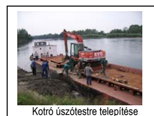
Kotró úszótestre telepítése

A május-augusztus közötti uszály javítási (lemezcsere, festés) és a szeptemberi kotró úszótestre telepítési munkák után megkezdődött a Dráva folyó 74+000 fkm-ben levő kőmű elbontása.