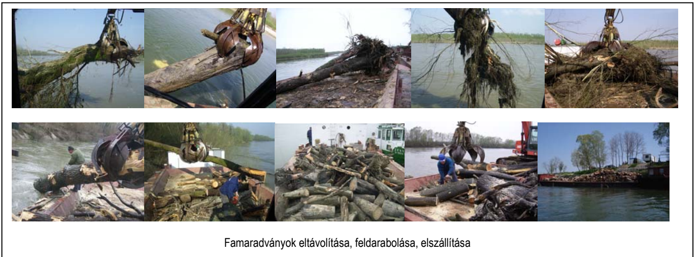
Famaradványok eltávolítása, feldarabolása, elszállítása