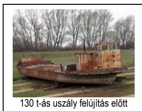
130 t-ás uszály felújítás előtt

A kőmű és a famaradványok eltávolításához, illetve azok elszállításához el kellett végeznünk a kotró munkagépünk úszótestre telepítését, valamint a 130 t-ás uszályunk javítási munkáit.